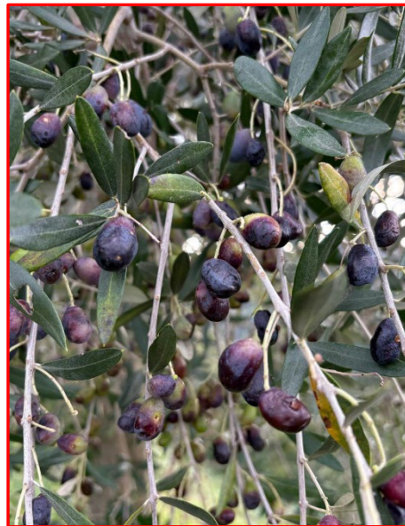
Fase fenologica- areale Sebino