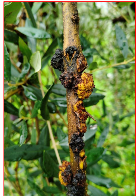
Nuovi tubercoli di Rogna in ingrossamento- areale Garda