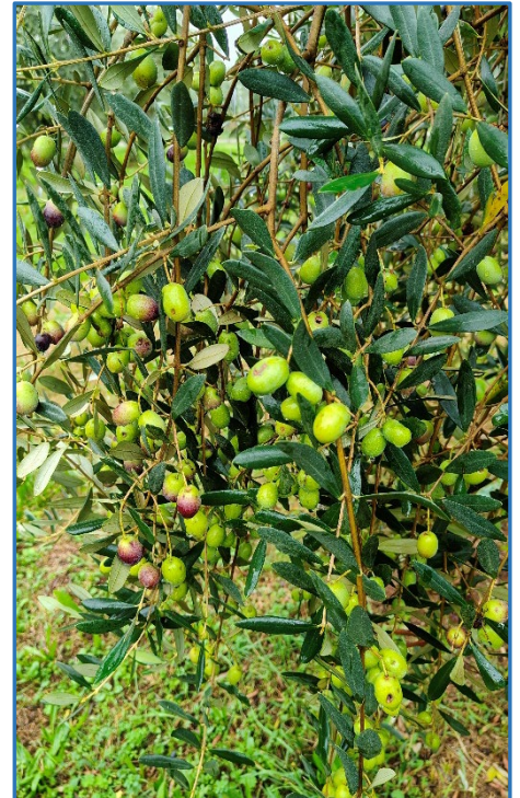
Fase fenologica Casaliva-Areale Garda