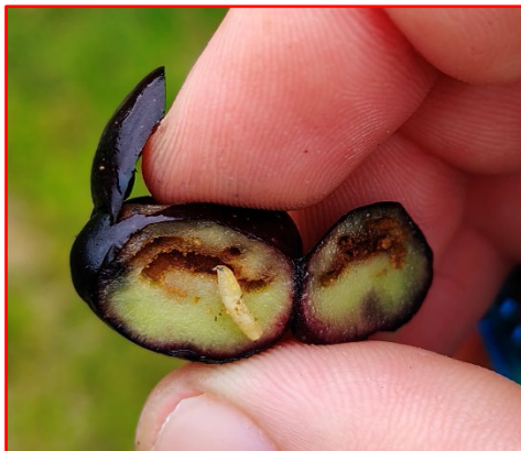
Larva di Terza età di mosca dell'olivo-areale Garda