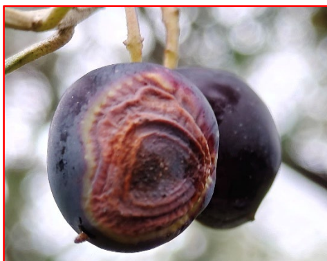
Oliva con sintomi di Lebbra dell'olivo-areale Garda