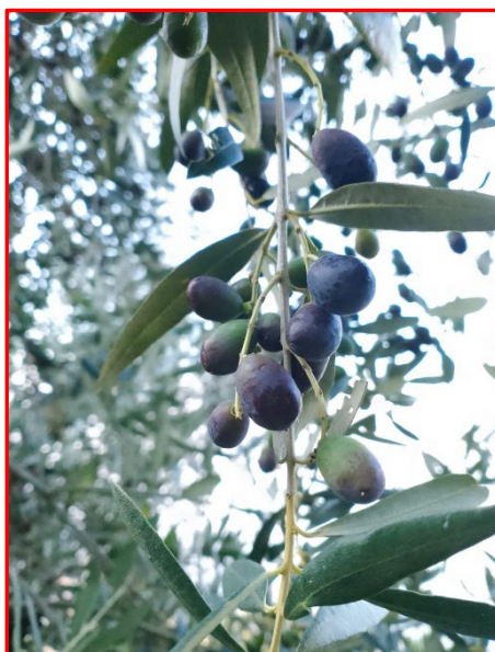
Fase fenologica- areale Lario